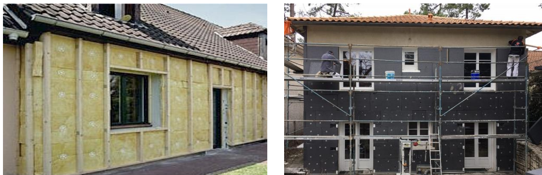
Exemple de chantier d'isolation par l'extérieur

Le plafond des travaux est à 30 000€ HT.